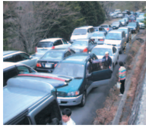
大台ヶ原ドライブウェイでの路肩駐車

年間約15万もの人が訪れる大台ヶ原。しかし、行楽シーズンには駐車場もすぐ満車になるため、ドライブウェイでは渋滞や路肩駐車が発生します。自然環境への影響はもちろん、なかなか目的地にたどり着けず、トレや休憩所もない道路の真ん中で立ち往生…せっかくの楽しい旅が台無しに。