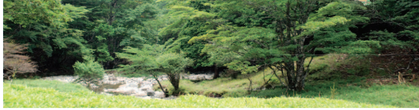
大台ヶ原 ナゴヤ谷の風景(西大台利用調整地区)