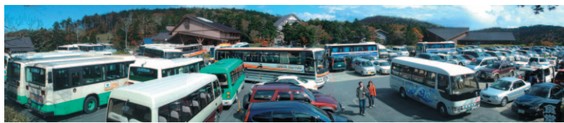
混雑する大台ヶ原駐車場(山上)

10月、11月の行楽シーズンでは、特に祝日を含む連休などに来訪者が集中します。混雑が予想される土日祝日はなるべく避けて来訪されることをお勧めします。