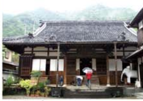
景徳寺 平氏ゆかりの禅寺で、如意輪観音坐像や弓矢祭などの文化財があります。