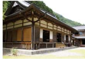
瀧川寺 北山の宮(後亀山天皇玄孫)の御墓があり後南朝衰史の君として伝えられています。