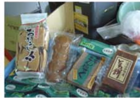
特産品加工センター 伝統的な製造法にこだわった手作りのこんにやくなどの様々な特産品があります。