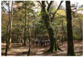
大台ヶ原 西大台地区 広大なブナの原生林の中を縫うように歩くコースで神秘的なムードが味わえます。