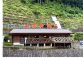
上北山温泉(薬師湯) 清流北山川のほとりにあり、県下有数の豊富な湧出量を誇る泉質の良い温泉です。