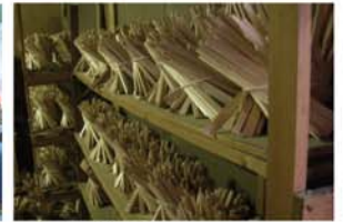
新屋製箸所 吉野杉の建築材の端材を無駄なく活用した香り高い風雅な箸を作っています。