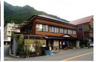
お宿 ふきや 山・川・海の幸を用いた手作りのおふくろの味を堪能できる懐かしい田舎のお宿です。