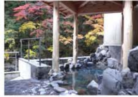
小処温泉 大台ヶ原の麓に位置し、小椋川の渓谷美を楽しめる露天風呂があります。