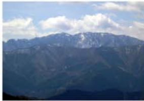
又劔山 上北山村内屈指の大展望が楽しめる登山コースです。