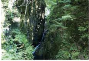
くらがり又谷の滝 落差50m以上の幾重にも重なる名瀑で「やまどの水」にも選ばれています。