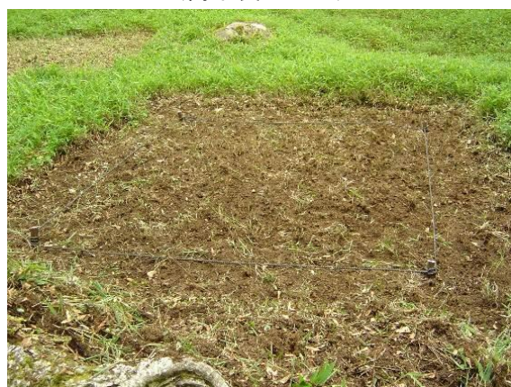
写真 2-1-5 表層土対策 (地掻き)