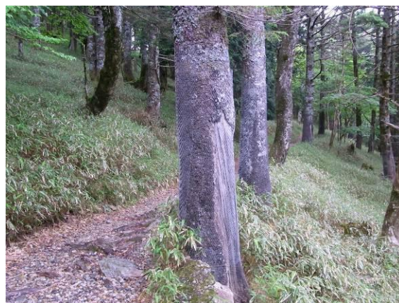
写真 2-1-2 剥皮防止用ネット (金属製ネット)