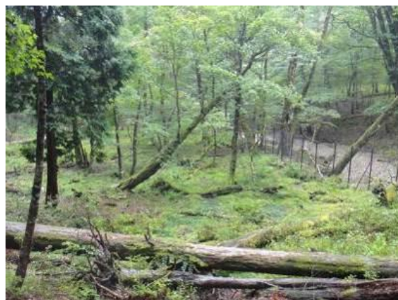
写真 2-3-2 生物多様性保全防鹿柵内の様子（コウヤ谷）