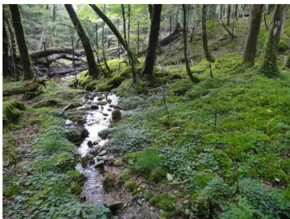
写真 2-3-1 溪流環境に設置した生物多様性保全防鹿柵内の様子

ニホンジカ等による植生の衰退に伴い衰退しつつある動植物の相互関係を調査し、その再生に向けた取組を実施する。