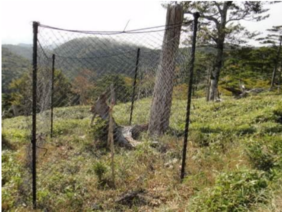
写真 2-1-7 稚樹保護柵(正木峠)