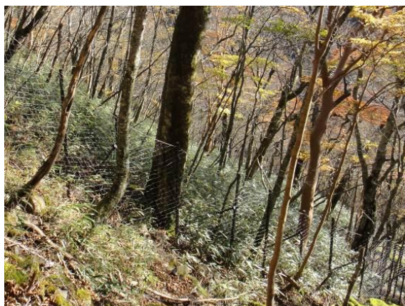
写真 2-1-1 大規模防鹿柵