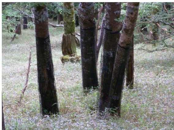
写真 2-1-3 剥皮防止用ネット (樹脂製ネット)