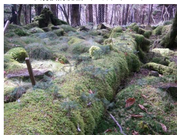
写真 2-1-6 倒木・根株の保全