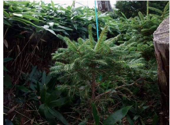
写真 2-1-8 自生稚樹周辺のミヤコザサの坪刈り