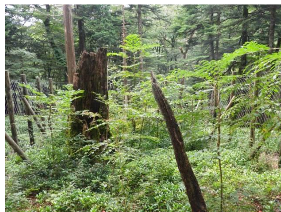
写真 2-1-4 林冠ギャップ地に設置した 小規模防鹿柵 (ハッチェイフェンス)