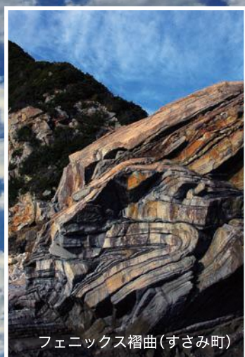
フェニックス褶曲(すさみ町)