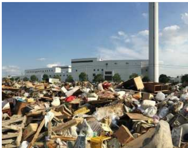
平成27年9月15日撮影 茨城県常総市 一次仮置場の搬入状況