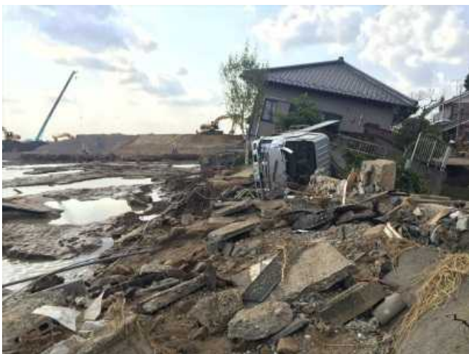
平成27年9月15日撮影 茨城県常総市 被災状況