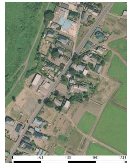
国土地理院地図(オルソ画像)