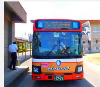
事業者による説明