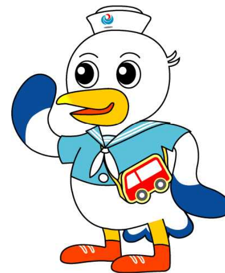
マスコットキャラクター こうべえ