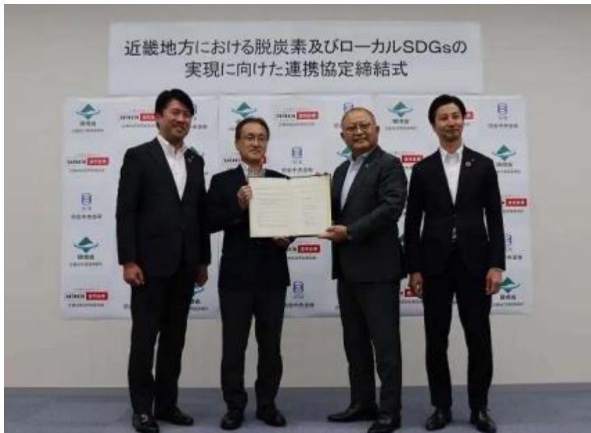
令和5年7月24日 協定締結式