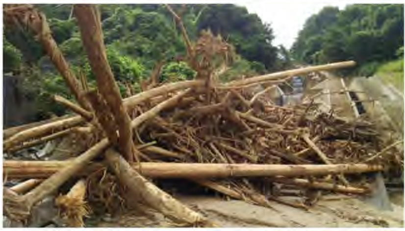
砂防堰堤を乗り越えた大量の 流木