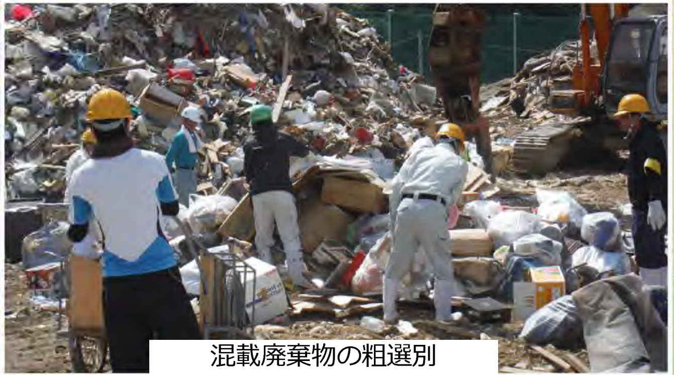
混載廃棄物の粗選別