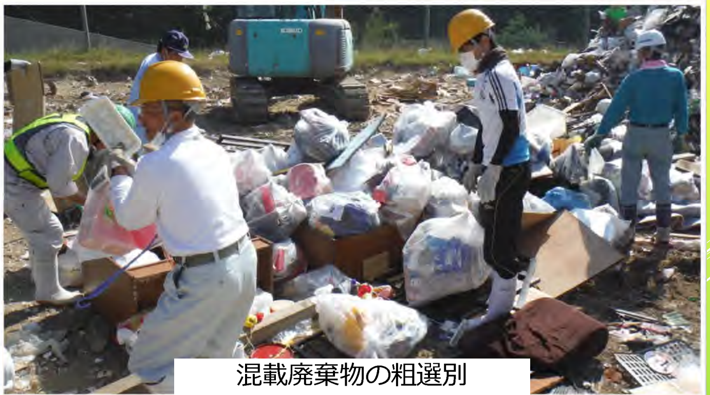
混載廃棄物の粗選別