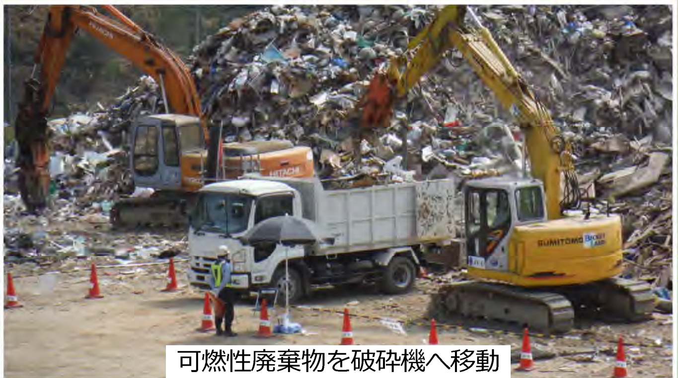
可燃性廃棄物を破砕機へ移動