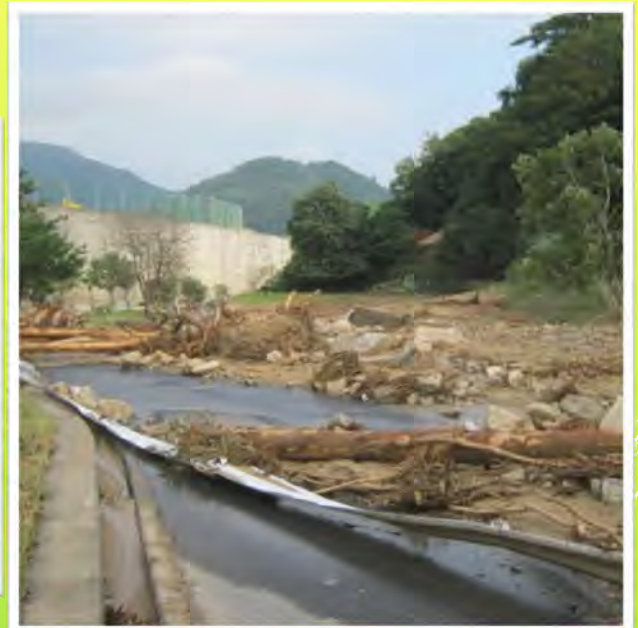
搬入路を塞いだ土砂