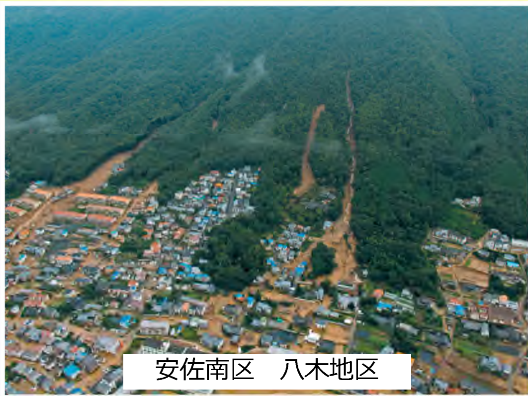
安佐南区 八木地区