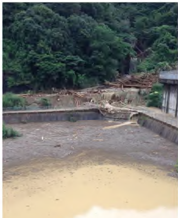
土砂が流入した雨水調整池