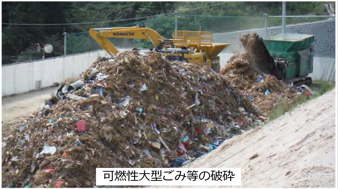
可燃性大型ごみ等の破碎