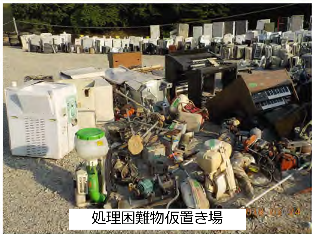
処理困難物仮置き場