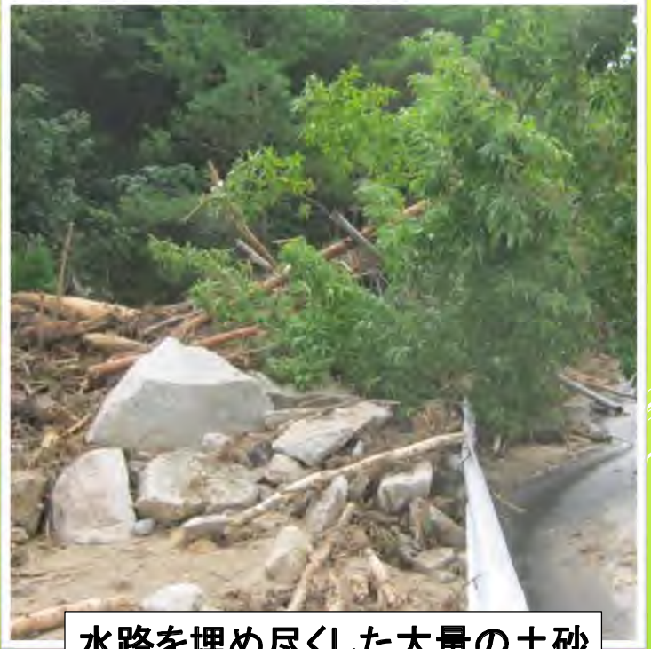
水路を埋め尽くした大量の土砂