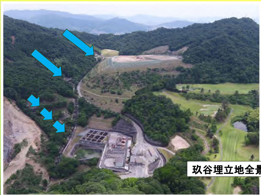
玖谷埋立地全景(現在)