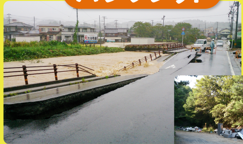
平成25年台風18号による被害状況