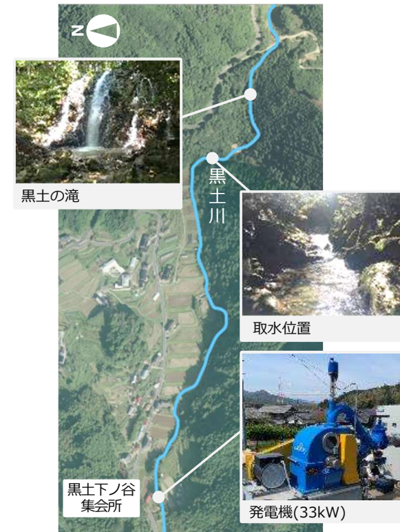
黒土川小水力発電（宍粟市）【建設中】