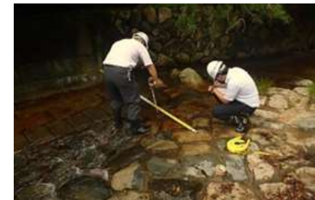
専門家による現地調査 【小水力発電】

補助対象経費 勉強会、現地調査、先進地視察等に要する経費 補助上限額 30万円（定額）