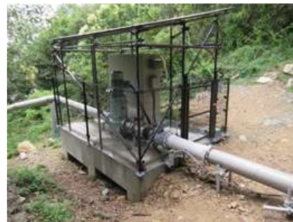
六甲川小水力発電（神戸市）