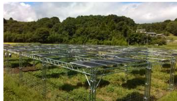
ソーラーシェアリング（宝塚市）