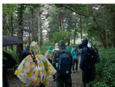
教員向けエクスカージョン

登録ガイドや自然再生委員による大台ヶ原ガイドイベント（ガイドウォーク）、ユネスコエコパークと連携した実施学校教員向けエクスカージョン事業を実施