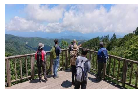
大台ヶ原ガイドウォーク