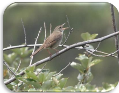
ウチャマセンニュー