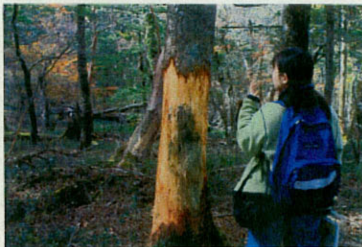
写真 剥皮された樹木 (ウラジロモミ)