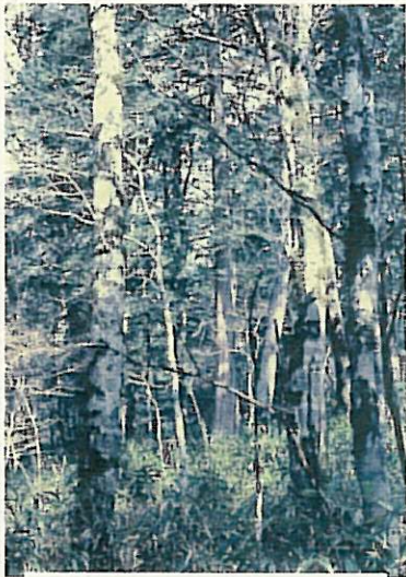
1969年11月：ブナ林 林床はスズカケが優占する。

「大台ヶ原原生林における植生変化の実態と保護管理手法に関する調査報告書」(菅沼・内山、1984)より抜粋