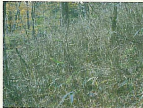
2002年11月：ブナ林 林床植生は減少し、枯れたスズカケが増加。