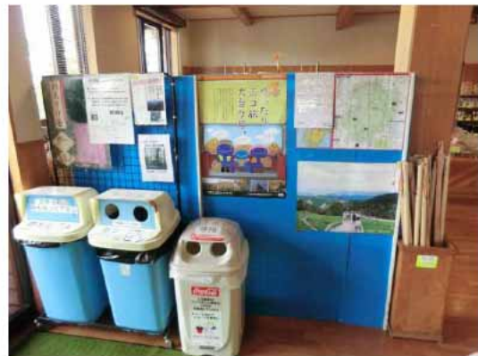
写真2：ポスターの掲出状況(上北山村物産店)