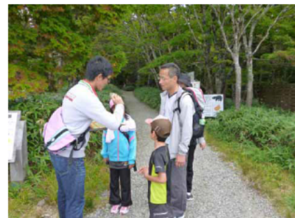
写真4：普及啓発イベントの実施状況2