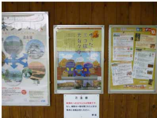
写真1：ポスターの掲出状況(近鉄大和上市駅構内)