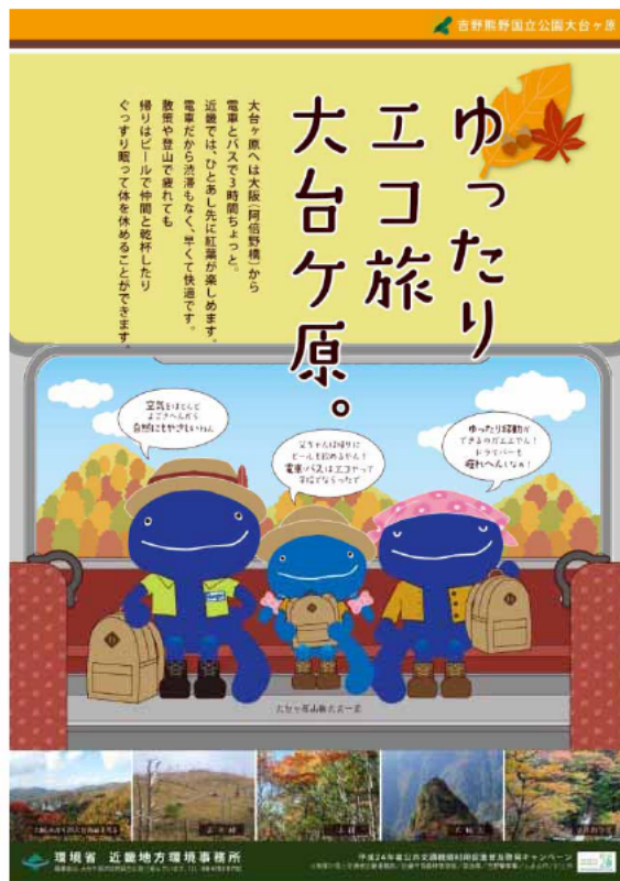
図1：ポスター・リーフレットのデザイン(おもて面)