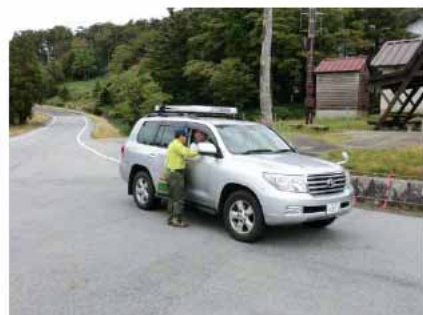
写真3：普及啓発イベントの実施状況1