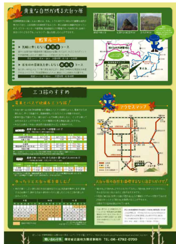
図2：リーフレットのデザイン(うらな面)