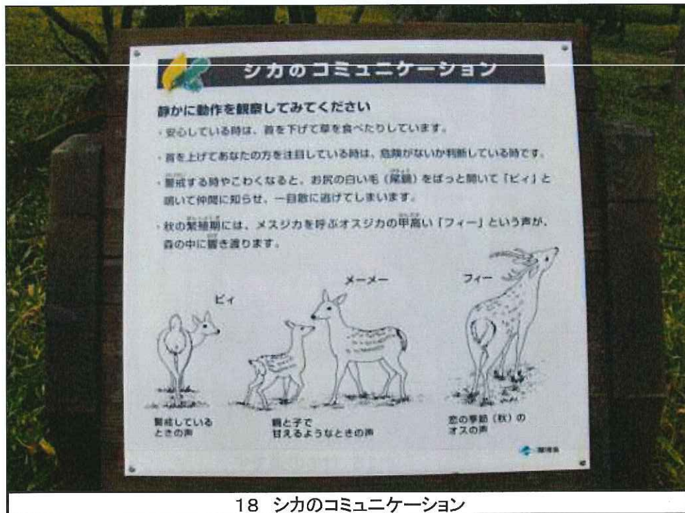
18 シカのコミュニケーション