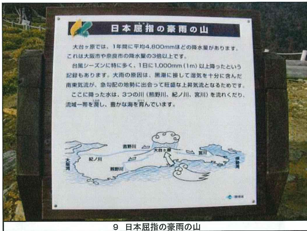
9 日本屈指の豪雨の山