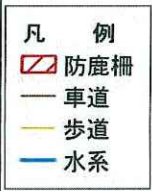
平成 21~23 年度防鹿柵設置箇所位置図