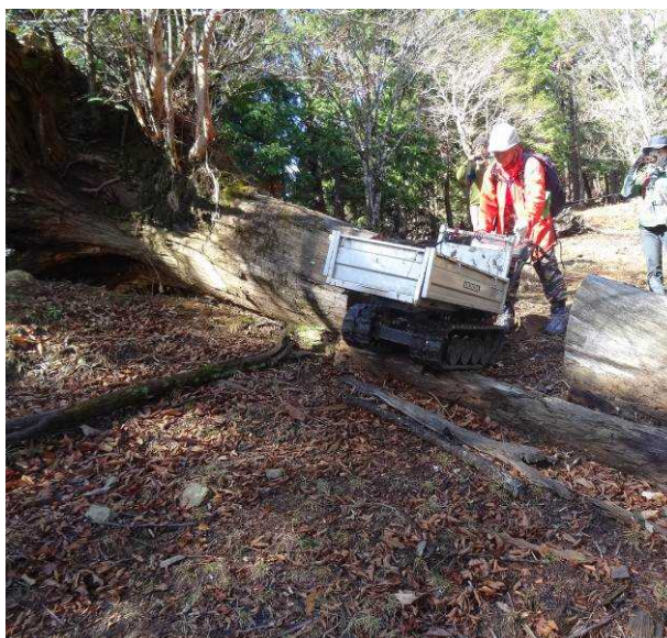
図 6-59 No.64