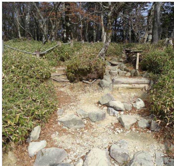
図 6-34 No.33 階段歩道が続く箇所