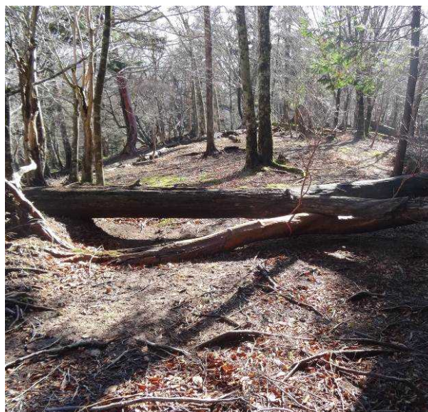
図 6-60 No.65