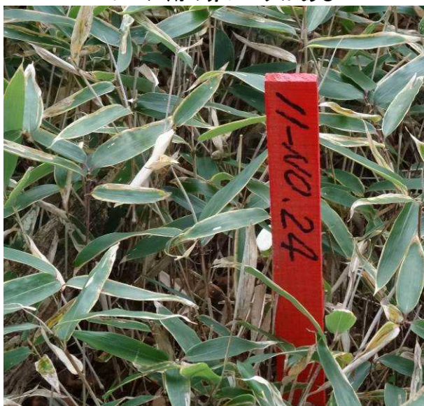
図 6-43 No.48 不整地運搬車ルート道(1) モノレール用の赤いベグがある