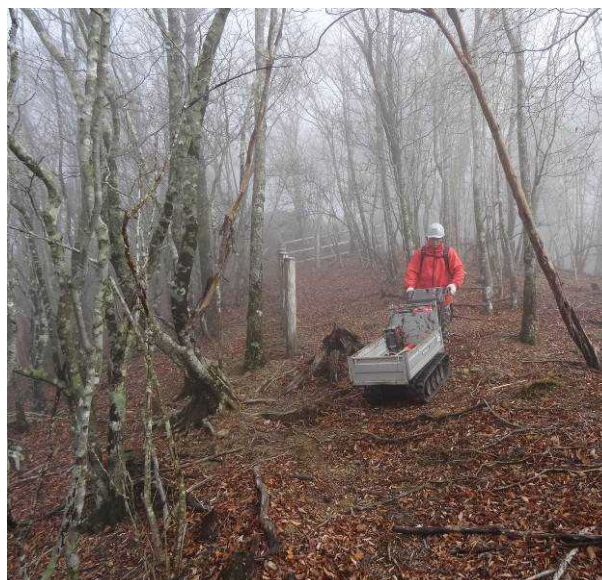
図 6-50 No.55 「不整地運搬車道(3)」不整地運搬車走行中 経ヶ峰付近傾斜 15 度