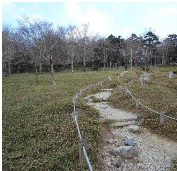
図 6-44 No.49 不整地運搬車ルート道(1) 歩道のそばを通過する