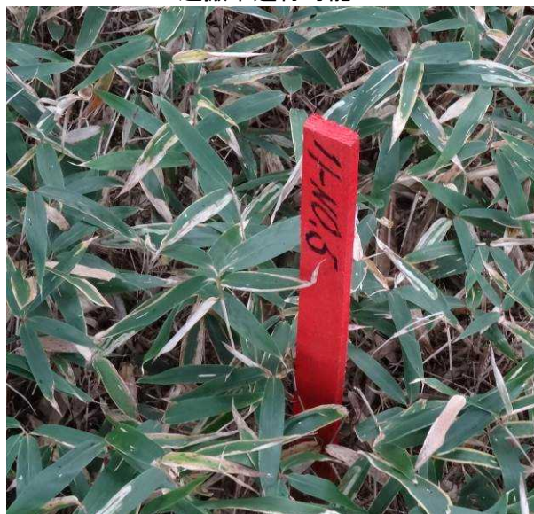
図 6-48 No.53 不整地運搬車ルート道(1) モノレール用の赤いペグがある