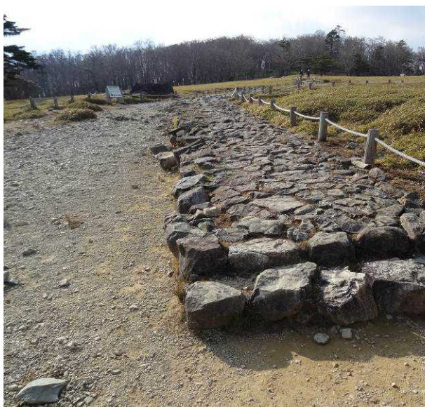
図 6-39 No.38 牛石ヶ原 石を敷き詰めた歩道