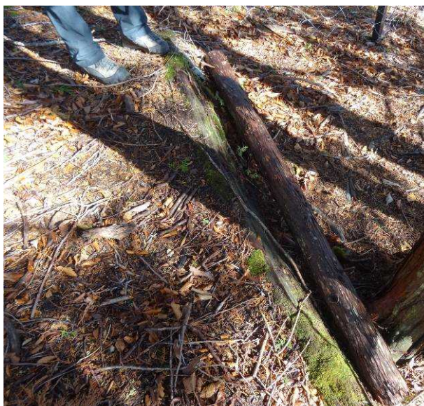
図 6-57 No.62