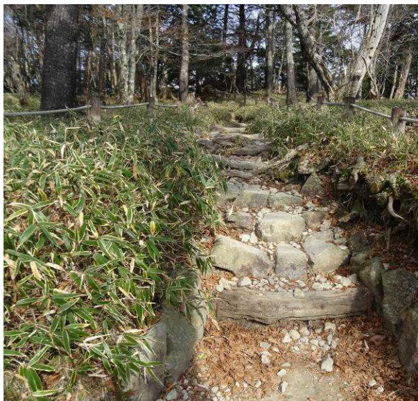
図 6-33 No.32 階段歩道が続く箇所