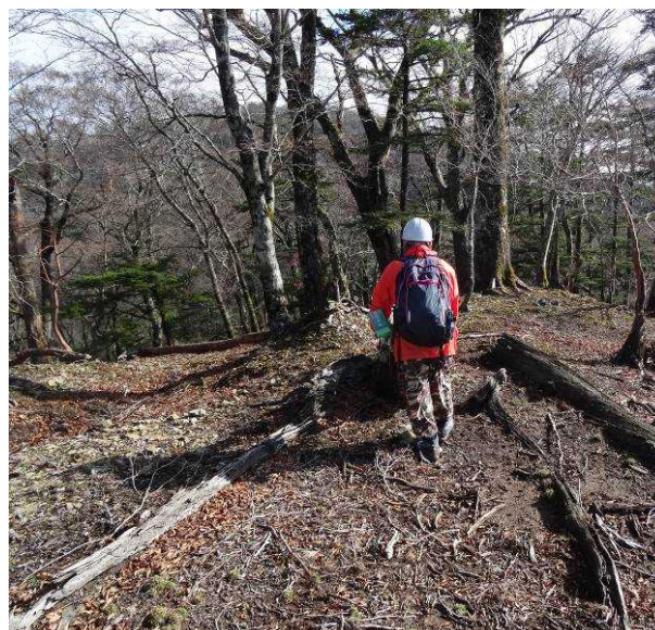
図 6-54 No.59