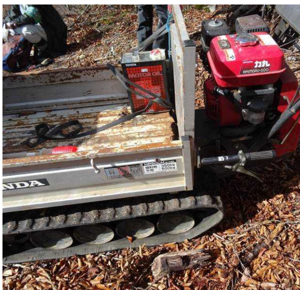
図 6-55 No.60