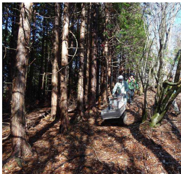
図 6-62 No.67