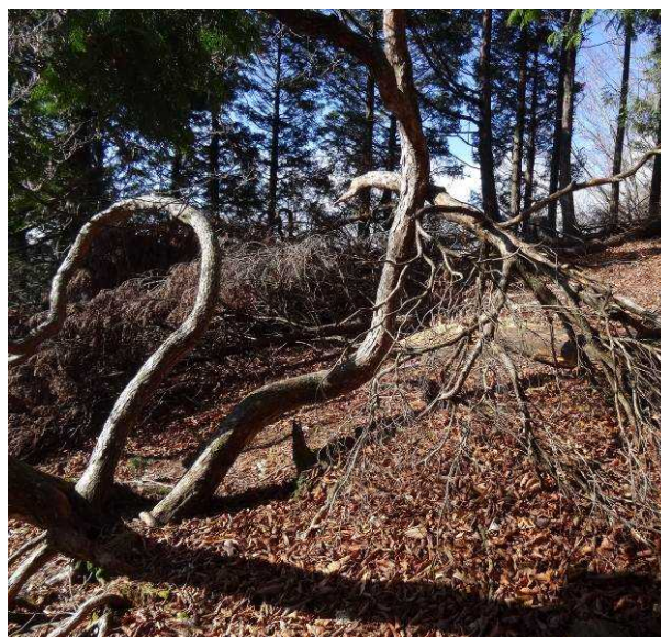
図 6-58 No.63