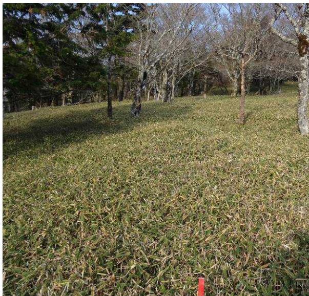
図 6-45 No.50 不整地運搬車ルート道(1)