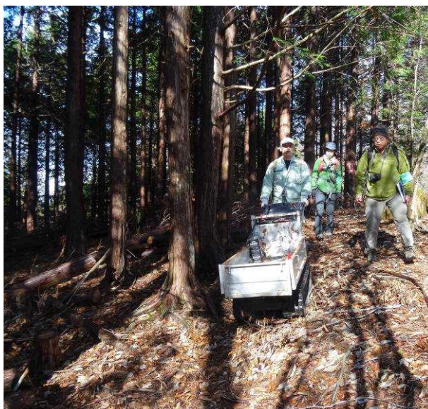
図 6-61 No.66