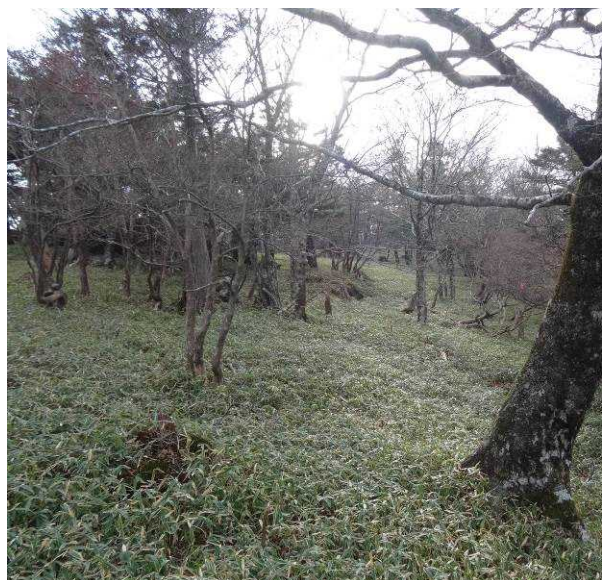
図 6-42 No.47 不整地運搬車ルート道(1)