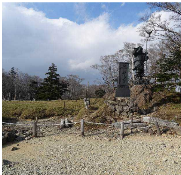
図 6-38 No.37 牛石ヶ原 神武天皇陵前