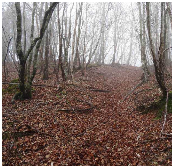
図 6-52 No.57 「不整地運搬車道(3)」不整地運搬車走行ルート 経ヶ峰付近傾斜 15 度