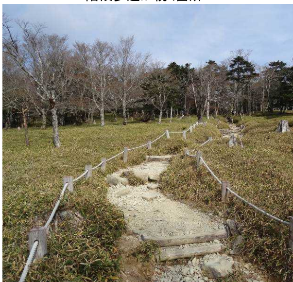
図 6-35 No.34 小さな段差