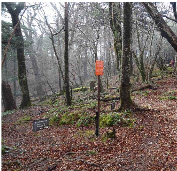
図 6-53 No.58