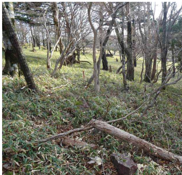
図 6-46 No.51 不整地運搬車ルート道(1) 生木や倒木がみられるが、ルートを選べば不整地 運搬車通行可能