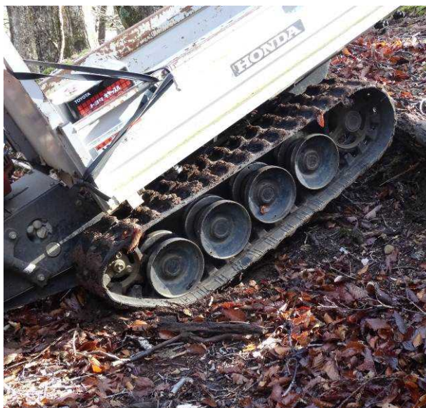
図 6-63 No.68