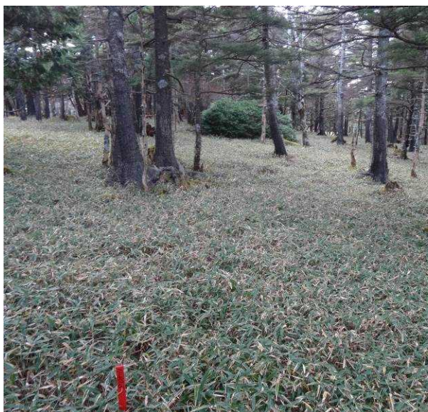
図 6-49 No.54 不整地運搬車ルート道(1)