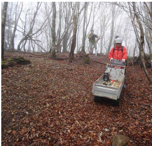
図 6-51 No.56 「不整地運搬車道(3)」不整地運搬車走行中 経ヶ峰付近傾斜 15 度