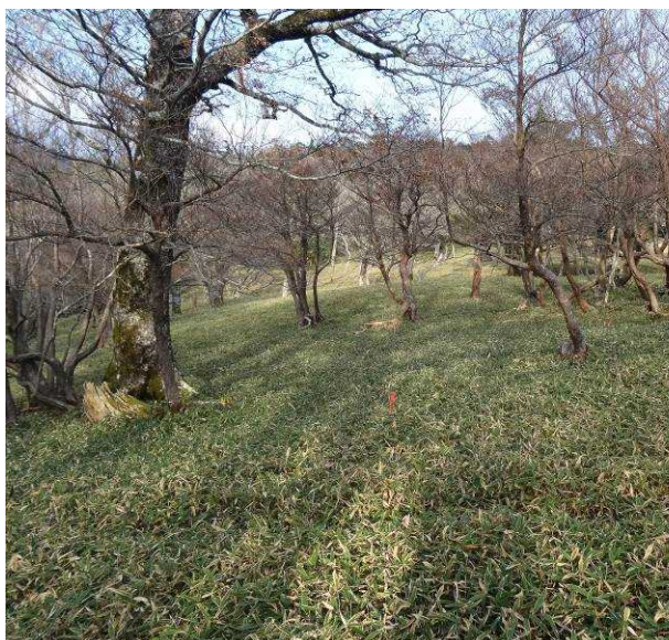
図 6-41 No.46 不整地運搬車ルート道(1) モノレール用の赤いベグがある