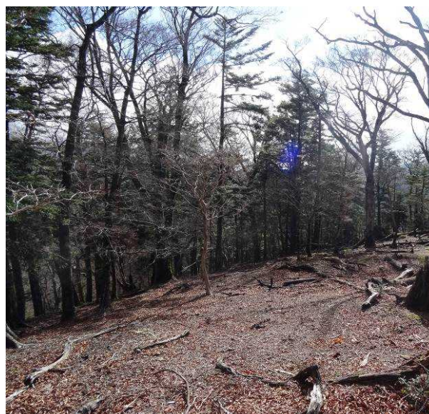
図 6-56 No.61