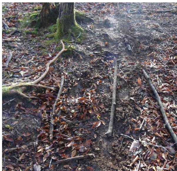
図 6-64 No.69