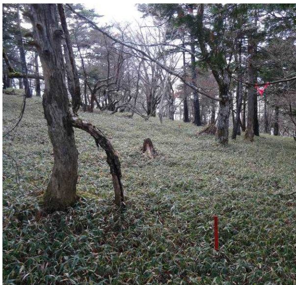
図 6-47 No.52 不整地運搬車ルート道(1)