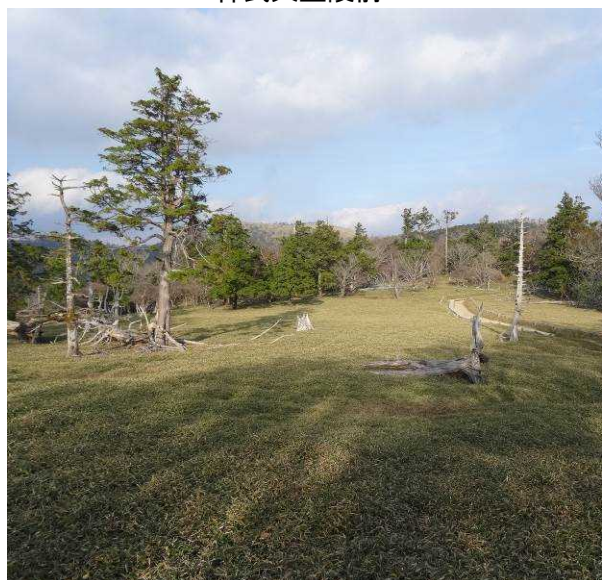
図 6-40 No.45 不整地運搬車ルート道(1)