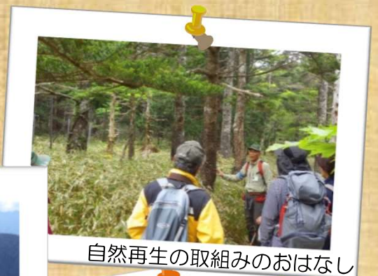
自然再生の取り組みのおはなし