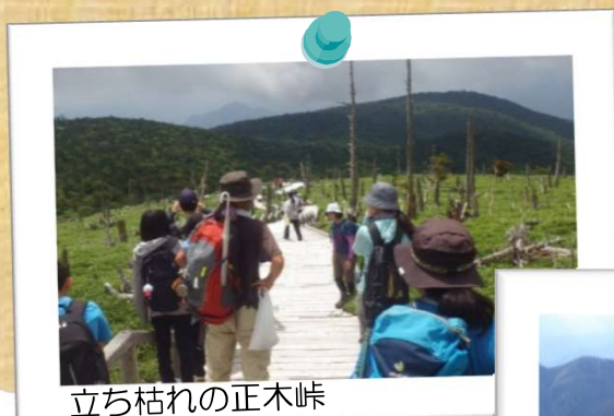
立ち枯れの正木峠