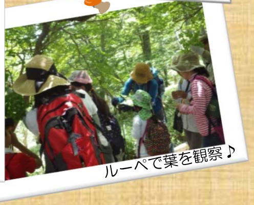
ルーペで葉を観察♪