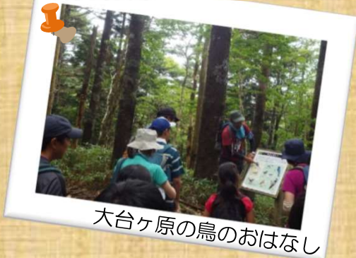
大台ヶ原の鳥のおはなし