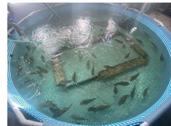
資料：ウィルステージ