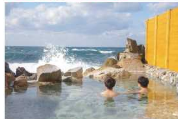
白浜温泉（崎の湯露天風呂）