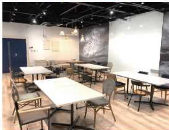
WORK×ation Site 南紀白浜